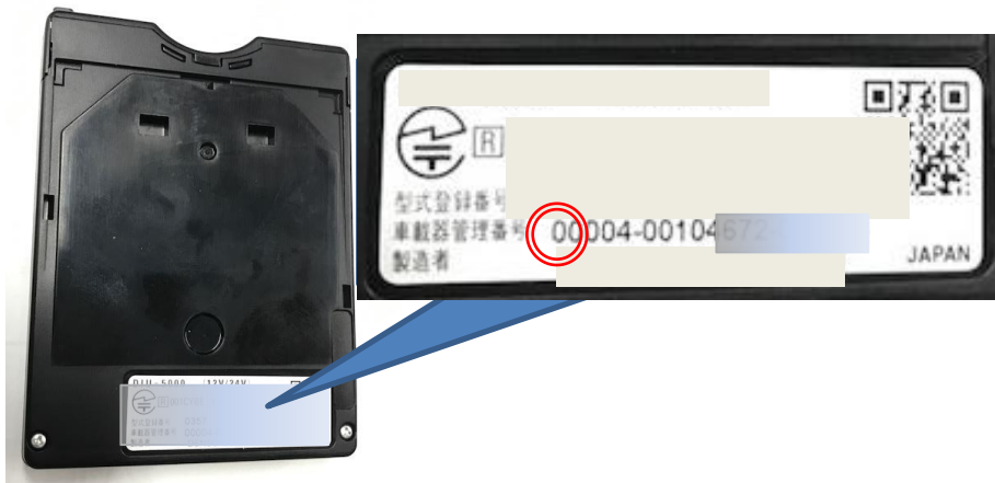
(写真): 旧セキュリティ対応車載器