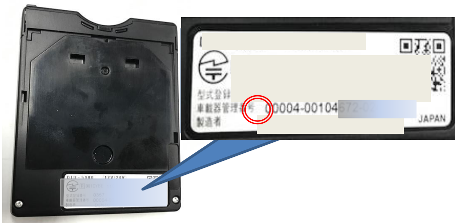
(写真): 旧セキュリティ対応車載器