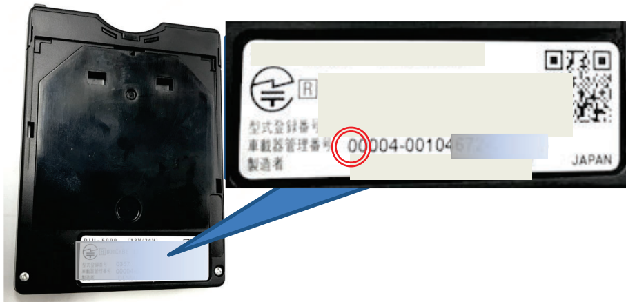
(写真): 旧セキュリティ対応車載器